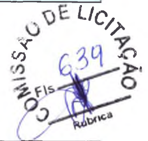
TABELA SEINFRA V024.1 (DESONERADA)