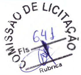
TABELA SEINFRA V024.1 (DESONERADA)