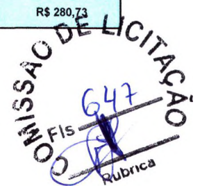
TABELA SEINFRA V024.1 (DESONERADA)