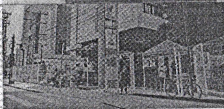
LJF: dois crimes brutais em menos de um ano