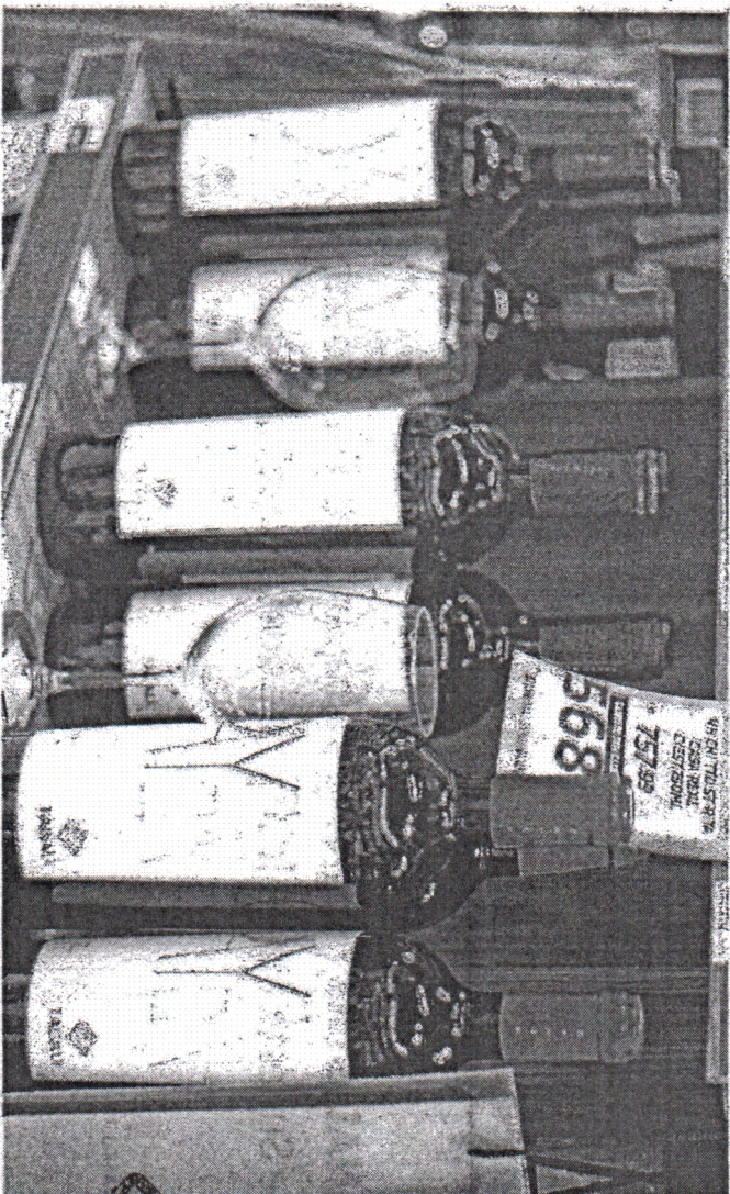
VINHOS estão entre os produtos pesquisados