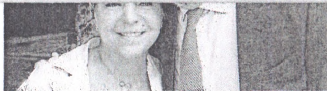
A DEPUTADA federal Luizianne Lins com o senador Cid Gomes

O deputado estadual alegou ser vítima de perseguição e desrespeito. Na ação, ele destacou não ter recebido