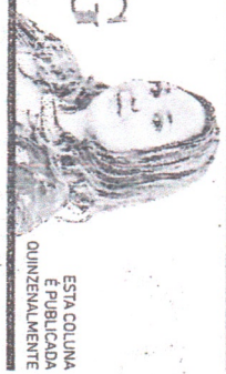
ESTA COLUNA É PUBLICADA QUINZENCIALMENTE